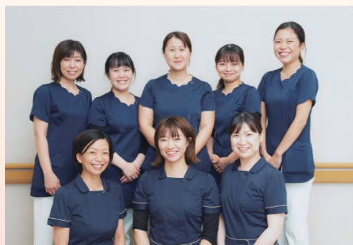
口腔看護部スタッフです よろしくお願ひします!

口内炎を自覚し、 数週間経過 しても治らない場合や、他の医療機関で治療受けるもなかなか治らない場合は、舌がん、頬粘膜がん、歯肉がん等の 悪性腫瘍 になっている場合がありますので、 要注意 です。口内炎に気付かれて、しばらくたっても治らない場合は早期口腔外科受診をお勧めします。 当科では初期検査として患部を拭うことでその病気の程度がわかる 細胞診 を行っております。切って摘出する病理組織検査と違い ほぼ無痛 でできる簡便な方法ですので、口腔内を触られることに抵抗感がある方々にもお勧めです。